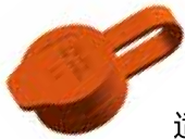
适用于阴接头的防尘帽